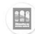
Alimentos del paraíso natural